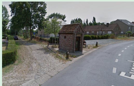
INGANG HALVERWEGE EVERSLAARSTRAAT TER HOOGTE VAN ONZE-LIEVE-VROUW VAN TROOST KAPEL