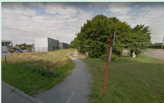
INGANG HOEK SPIEVELDSTRAAT & BOKSLAARSTRAAT

Starten doe je aan één van deze twee ingangen: